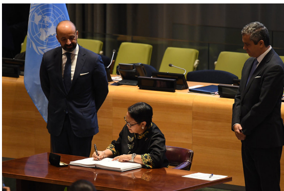
Gambar 2. Menlu Retno L.P Marsudi menandatangani TPNW di Markas PBB, New York, 20 September 2017.

nuklir, seperti Treaty of the Non-Proliferation of Nuclear Weapons (NPT, sejak 1979), Comprehensive Nuclear-Test-Ban Treaty (CTBT, 2011) dan Southeast Asian Nuclear Weapon Free Zone/ Bangkok Treaty (SEANWFZ, 1997). Indonesia juga pernah menjadi koordinator Kelompok Kerja Gerakan Non Blok (GNB) untuk Perlucutan Senjata sejak tahun 1994. Melalui posisi ini, Indonesia kerap mewakili negara-negara anggota GNB menyampaikan kekhawatiran akan lambatnya proses pelucutan senjata.