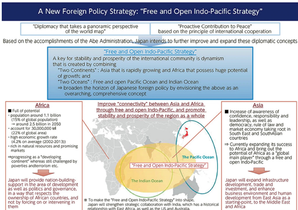
Gambar 1. Strategi FOIP oleh Jepang

Gagasan Shinzo Abe mengenai Free and Open Indo-Pacific pada tahun 2007 kembali dipaparkan secara terbuka dalam The Sixth Tokyo International Conference on African Development (TICAD VI) di Nairobi, Kenya, pada bulan Agustus 2016. Dalam pidatonya, Abe menekankan bahwa kunci dari stabilitas dan kemakmuran komunitas internasional terletak pada dinamika yang tercipta dari sinergi antar dua benua yang memiliki potensi besar, yaitu Asia dan Afrika, serta dua samudra yang bebas dan terbuka, yaitu Hindia dan Pasifik. Dengan memandang kawasan ini sebagai satu kesatuan yang terintegrasi, Jepang berupaya untuk membuka babak baru dalam strategi diplomasi luar negerinya. Strategi ini berpijak pada keyakinan Abe bahwa laut yang bebas dan terbuka merupakan sumber dari adanya perdamaian dan kemakmuran dunia (Ministry of Foreign Affairs of Japan, 2017). Strategi ini kemudian dituangkan pada salah satu bagian dari Japan Diplomatic Bluebook 2017 (lihat: Gambar 1).